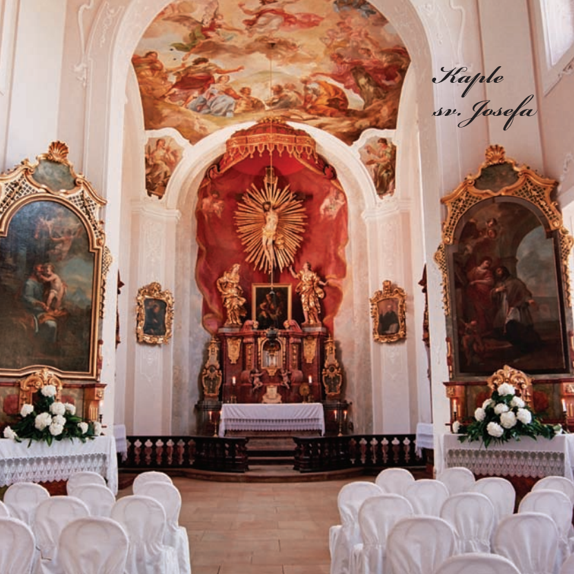
Kaple sv. Josefa